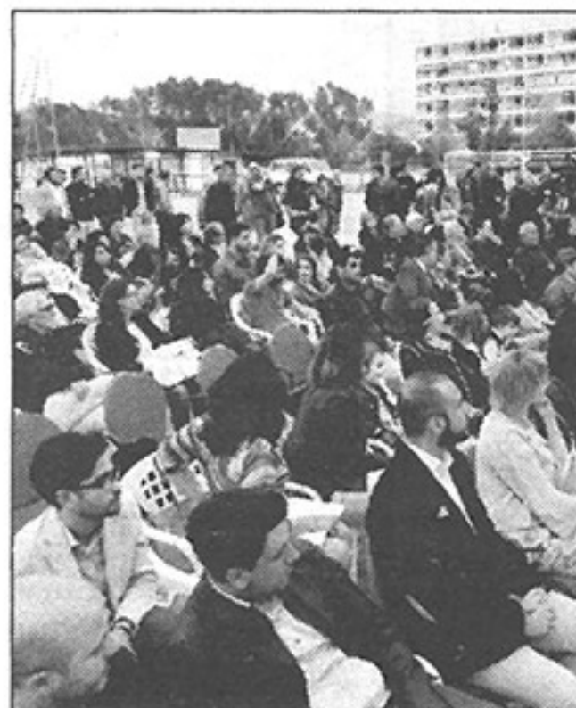
I cittadini presenti