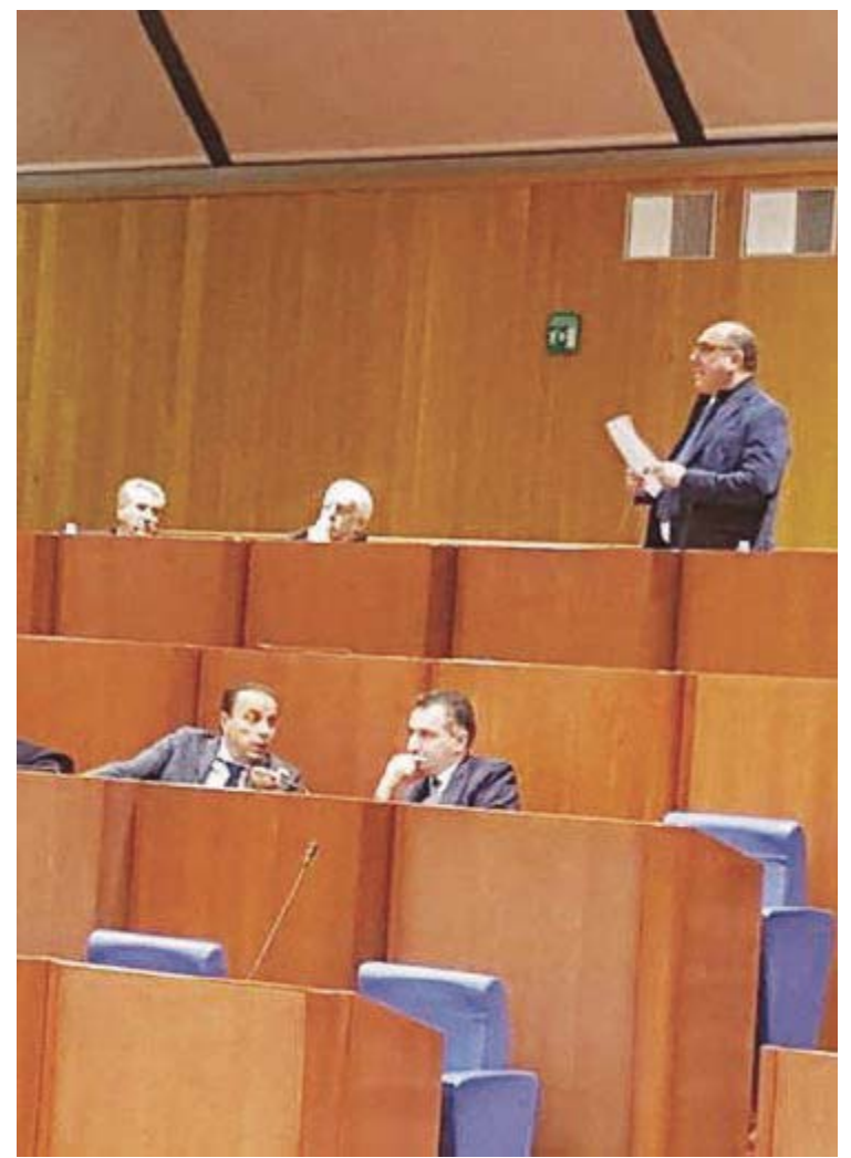
Interventi in Consiglio regionale